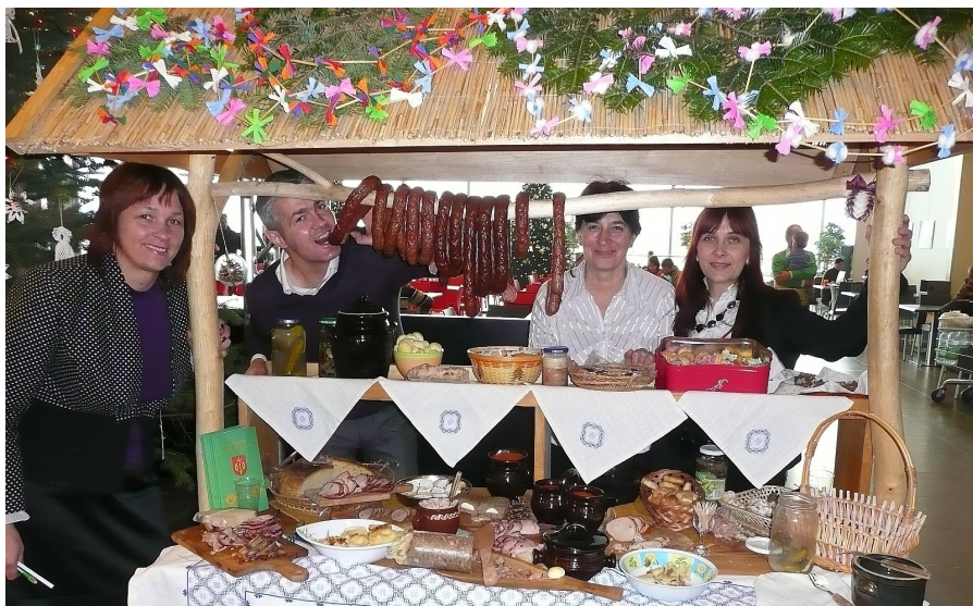
„Kuznia” aktywnie promuje regionalne potrawy, przygotowywane przez gospodynie z Kowalowej.